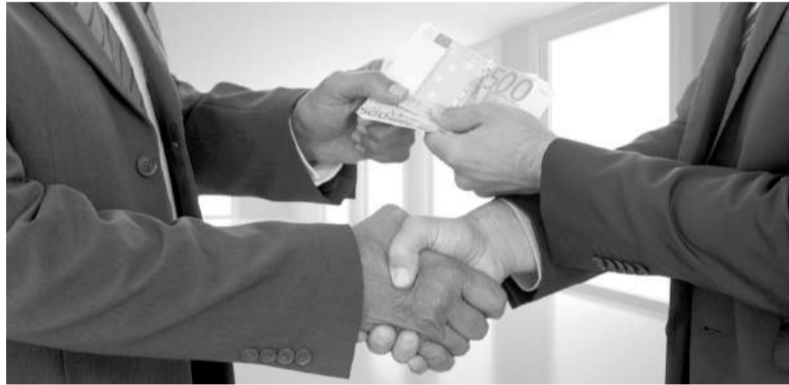
De acordo com as novas regras, os Estados-membros têm de prever níveis mínimos comuns de sanções para os crimes de corrupção, assegurando que as sanções máximas não sejam demasiado baixas