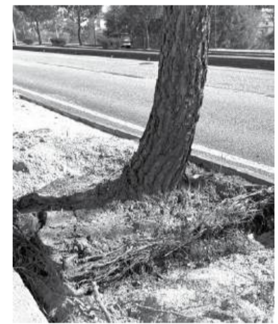
As raízes estão a destruir lancis e a levantar o chão

Parece que em Coimbra nem só os estudantes têm dificuldades em "criar raízes", porque, agora, até os pinheiros-mansos da Avenida Elísio de Moura decidiram que o subsolo da cidade é demasiado claustrofóbico para os seus padrões. Graças a um parecer técnico da Universidade de Coimbra, descobriu-se que as árvores andavam a sofrer de um "efeito de colete-de-forças". Pelos vistos, alguém no passado achou que plantar árvores sobre um antigo pavimento enterrado era uma ideia brilhante de design urbano. As raízes, impedidas de descer por uma barreira impermeável, decidiram revoltar-se, destruindo lancis e levantando o chão. A sentença é o abate dos pinheiros, uma decisão apoiada até pelo movimento ClimAção Centro, que admite que o erro histórico de planeamento não deixa alternativa. Embora a Câmara não queira entrar em detalhes numéricos, estima-se que até 47 pinheiros-mansos passem pelas mãos da serra eléctrica. E não deixa de ser irónico que, numa cidade que tanto se orgulha das suas fundações históricas, sejam precisamente as "fundações" mal feitas de uma avenida a ditar o fim de dezenas de árvores. Resta-nos esperar que, na próxima vez que alguém decidir plantar algo em Coimbra, se lembrem de verificar se não há uma estrada romana ou um pavimento do século passado a servir de "tampa" para a natureza.