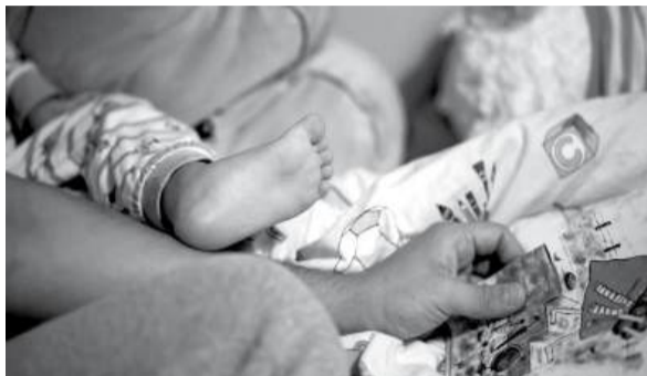
Criança desaparecida estava, na verdade, dormir a sesta no armário