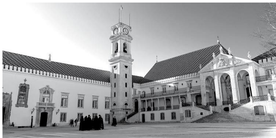
O Conselho Geral da Universidade de Coimbra reúne-se a 29 de Junho, sendo que da ordem de trabalhos consta o regulamento inerente à eleição do(a) futuro(a) reitor(a)

O jurista foi interpelado pelo nosso Jornal acerca do alcance da aplicabilidade