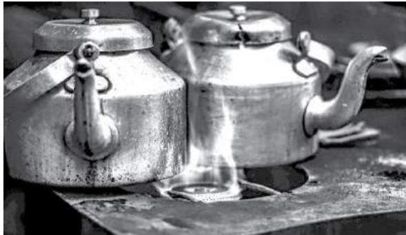
Assaltaram o restaurante "Cova Funda", mas o gás levou a melhor