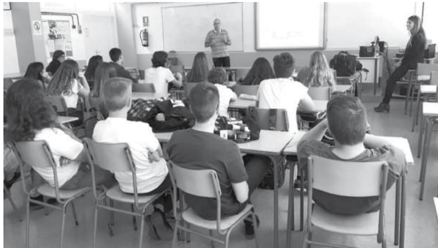
A escola pública depende de professores com estabilidade, recursos e tempo para acompanhar os diferentes ritmos dos alunos

Devolver voz aos professores significa reconhecer a sua autoridade profissional para experimentar, avaliar, partilhar práticas e construir transformação a partir do trabalho pedagógico. Sem essa dimensão pública, os docentes são chamados a responder à