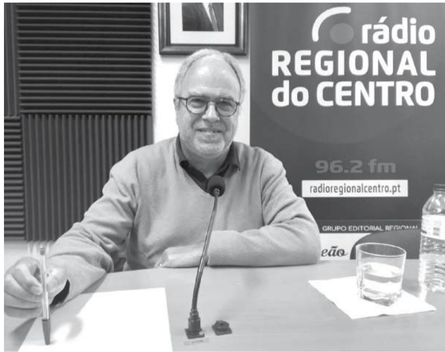
José Manuel Pureza: "Os populismos e as extremas-direitas vivem da crise social, do descontentamento e da aflição"

Professor de Relações Internacionais da Universidade de Coimbra e coordenador do Bloco de Esquerda, José Manuel Pureza esteve na Rádio Regional do Centro para ajudar a perceber os conflitos crescentes a que o mundo assiste, em particular a escalada entre os Estados Unidos da América e o Irão. Numa leitura crítica e abrangente, falou da crise da ordem internacional, do papel da China, da fragilidade da Europa e dos custos sociais que esta instabilidade já está a fazer sentir.