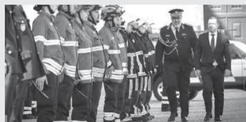
A Associação Humanitária de Bombeiros Voluntários de Coimbra completou, a 7 de Abril, 137 anos