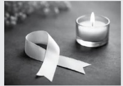
O aumento do subsídio de funeral corrige uma falha antiga do sistema e devolve alguma justiça a famílias em momentos de extrema vulnerabilidade