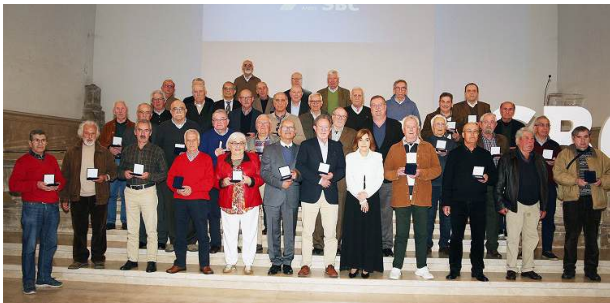
Bancários distinguidos nos 90 anos do SBC