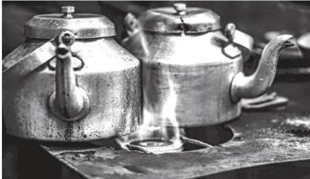
Assaltaram o restaurante "Cova Funda", mas o gás levou a melhor