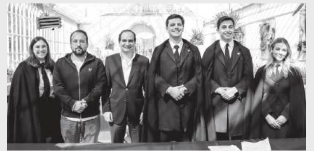
Parceria entre a AAC e a Universidade de Coimbra coloca os estudantes no centro da solução para os desafios estruturais da cidade