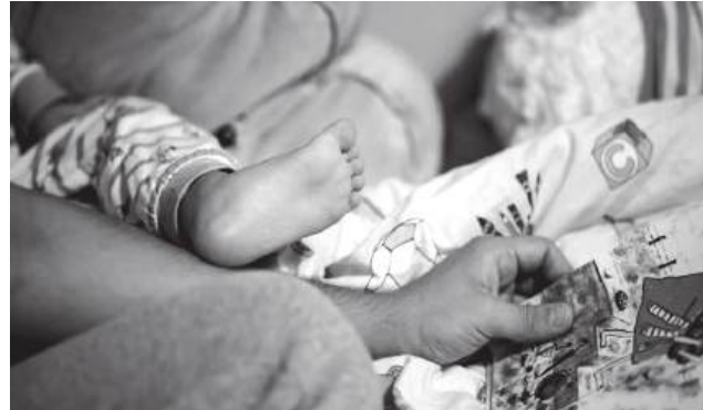
Criança desaparecida estava, na verdade, dormir a sesta no armário