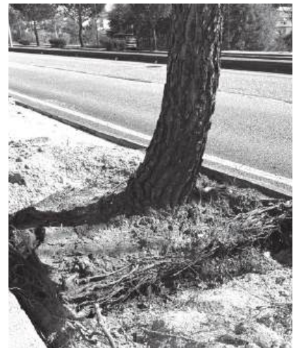
As raízes estão a destruir lancis e a levantar o chão

Parece que em Coimbra nem só os estudantes têm dificuldades em "criar raízes", porque, agora, até os pinheiros-mansos da Avenida Elísio de Moura decidiram que o subsolo da cidade é demasiado claustrofóbico para os seus padrões. Graças a um parecer técnico da Universidade de Coimbra, descobriu-se que