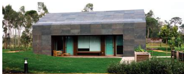
A casa de banho desta habitação avalia a frequência cardíaca e respiratória, entre outros sinais vitais

No Hospital Rovisco Pais, na Tocha (Cantanhede), é inaugurada hoje a Casa VIVA+ Engenheiro António Oliveira. Este projecto pioneiro, que representa um investimento superior a 16 milhões de euros, nasce como um “laboratório vivo” destinado a revolucionar a forma como a tecnologia e a saúde se integram no ambiente doméstico.