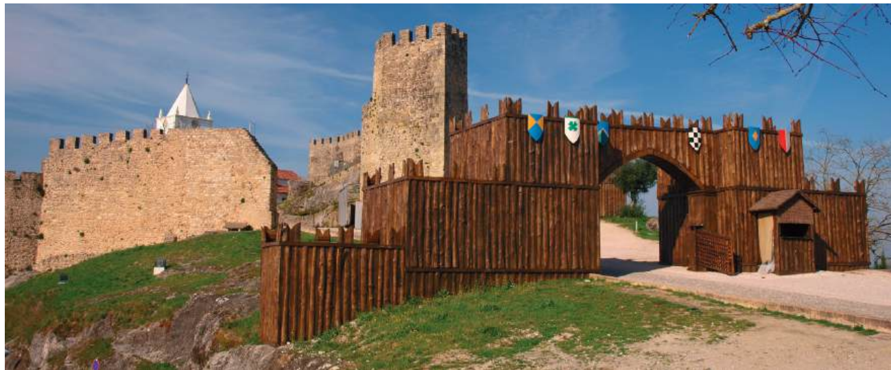
O Castelo de Penela, cenário de história, pedra e memória, volta a ganhar vida como palco da XXX Feira Medieval, onde a vila celebra as suas raízes e convida todos a atravessar as portas do tempo