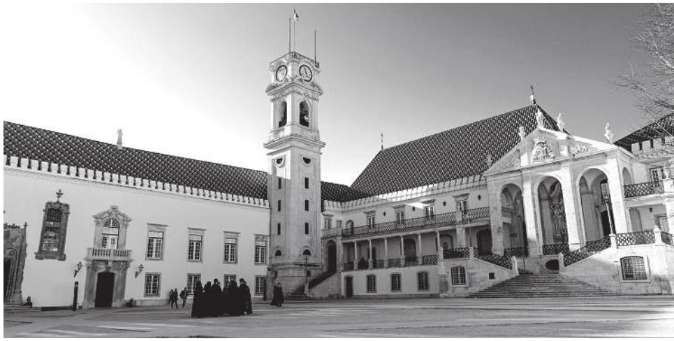
O Conselho Geral da Universidade de Coimbra reúne-se a 29 de Junho, sendo que da ordem de trabalhos consta o regulamento inerente à eleição do(a) futuro(a) reitor(a)

O jurista foi interpelado pelo nosso Jornal acerca do alcance da aplicabilidade