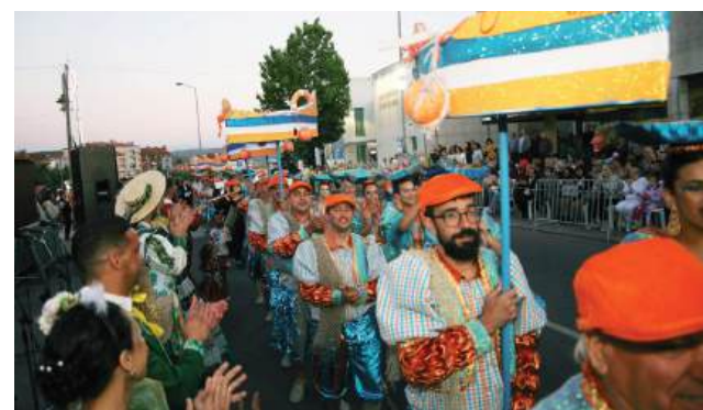
As marchas populares, uma das expressões da vertente festiva e comunitária da Romaria do Espírito Santo, voltarão a desfilar em Santo António dos Olivais este ano

A edição de 2026 inclui ainda uma homenagem a 10 casais que, este ano, completem 50 ou mais anos de casamento. O programa das Bodas de Ouro prevê missa às 12h00 na Igreja de Santo António dos Olivais, almoço-convívio e entrega de uma lembrança. A iniciativa reforça o carácter comunitário da romaria, que não se limita à ocupação festiva do largo, mas