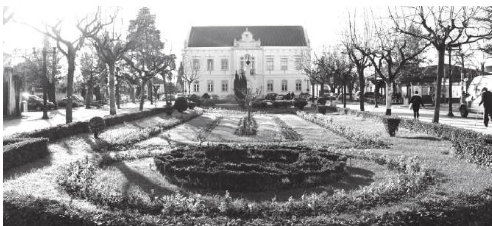
Um lugar icónico e central, a Câmara da Mealhada e o Jardim Municipal

A pergunta permanece em aberto. A Mealhada pensa-se a si própria? Talvez a resposta continue a ser "nim". E talvez o mais preocupante seja o facto de essa ambiguidade começar a parecer normal.