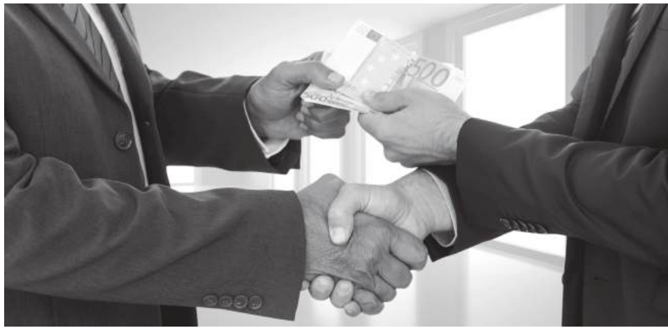
De acordo com as novas regras, os Estados-membros têm de prever níveis mínimos comuns de sanções para os crimes de corrupção, assegurando que as sanções máximas não sejam demasiado baixas