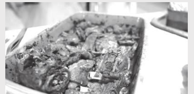
Sabores que contam a história de Condeixa: o Festival do Cabrito e da Escarpiada regressa à mesa este fim-de-semana, entre tradição, convívio e património

Condeixa-a-Nova volta a pôr a tradição à mesa. Depois do primeiro fim-de-semana do Festival do Cabrito e da Escarpiada, o certame regressa entre amanhã e domingo, de 8 a 10 de Maio, com 17 restaurantes aderentes e um convite simples: provar dois dos sabores mais identitários do concelho e ficar para descobrir a sua história. Sob o mote "Venha pelos sabores, fique pela história", a edição deste ano apresenta um formato renovado, repartido por dois fins-de-semana, em vez da habitual semana contínua. A alteração, concertada com os restaurantes participantes, procura valorizar os dias mais associados ao convívio, às refeições demoradas e aos passeios em família ou entre amigos. Ao longo destes dias, o cabrito e a escarpiada assumem o papel principal nos menus dos restaurantes aderentes. O menu do