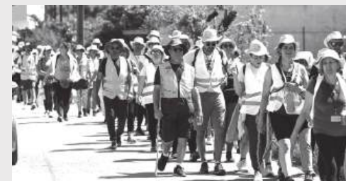
Peregrinos seguem a pé rumo a Fátima, movidos pela fé, pela esperança e pela gratidão, numa caminhada que pede também atenção e respeito nas estradas

E todos podemos ajudar a que chegue em segurança.