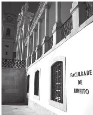
O documento é subscrito por 70 docentes da Faculdade de Direito de Coimbra

Segundo o documento, “esta nova cultura institucional tem, hoje em dia,