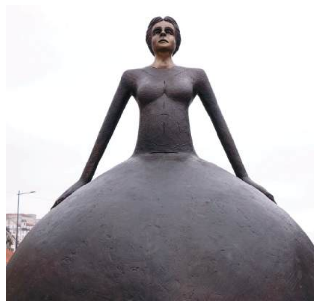
A peça recupera e transforma o mito fundador da cidade da princesa Cindazunda

“Eu acho que a própria cidade se acha um pouco ‘The Best City to Live and to Love’ [a melhor cidade para viver e amar]. Sempre achei - não sou de cá - e há essa brincadeira com o reflexo que a cidade tem dela própria”.