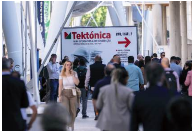
O sector da Construção está numa fase de "forte transformação, impulsionada por exigências crescentes ao nível da eficiência energética, sustentabilidade e inovação tecnológica"

Ao nível internacional, José Paulo Pinto destaca o crescimento da participação estrangeira, com empresas de 15 países. "Em particular,