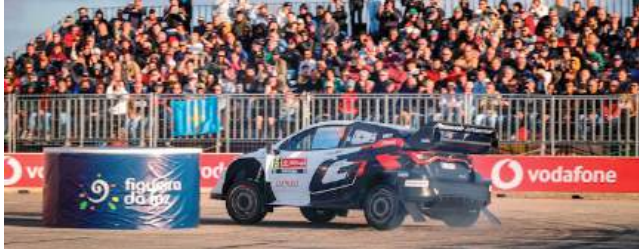
A Figueira da Foz recebe a Super Especial do Rally de Portugal junto ao Forte de Santa Catarina, num traçado urbano com o Atlântico como pano de fundo

A Figueira da Foz volta a entrar no mapa do WRC Vodafone Rally de Portugal e fá-lo à sua maneira: com uma Super Especial curta, intensa e desenhada para aproximar o público da acção. A passagem pela cidade está marcada para hoje, 7 de Maio, às 18h05, encerrando o primeiro dia competitivo da prova, que decorre entre 7 e 10 de Maio. No calendário, surge como SS3 — Figueira da Foz, uma classificativa de 1,93 quilómetros que promete trocar a longa resistência dos troços de terra pelo espectáculo concentrado de uma arena urbana.