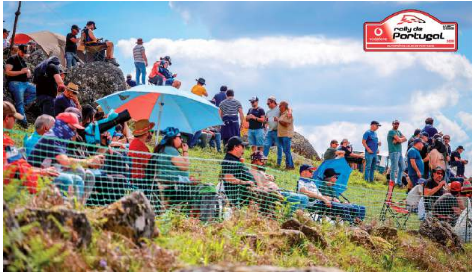
No Rally de Portugal assistir nas zonas autorizadas e seguir as indicações da organização é essencial para proteger o público, os pilotos e toda a prova

A organização reforça que os espectadores devem posicionar-se em locais elevados, protegidos e com espaço suficiente para se movimentarem rapidamente, caso seja necessário. Estar abaixo do nível