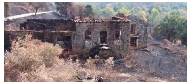
Nove anos depois... há processos pendentes