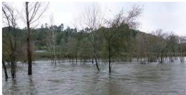
Cheias no Mondego voltaram a expor fragilidades na manutenção do sistema hidráulico entre Coimbra e a Figueira da Foz, que especialistas da Universidade de Coimbra defendem dever ser tratado como uma obra de engenharia

O especialista recorda que os diques foram concebidos para suportar cheias da ordem dos 2.000 metros cúbicos por segundo, mas ruíram três vezes nos últimos