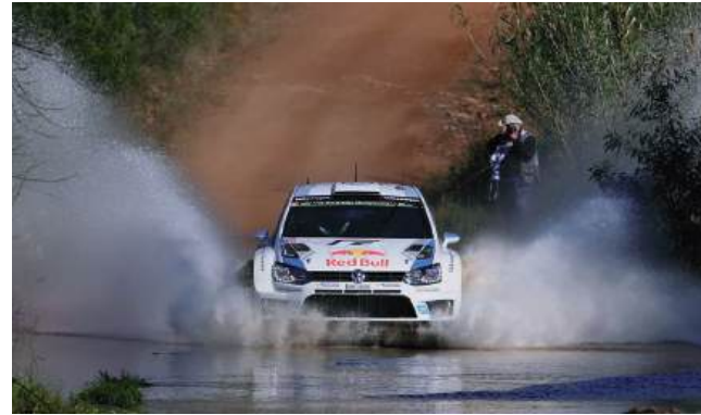
A festa começa em Coimbra, ganha alma no Centro, sobe de intensidade no Norte e termina com emoção em Fafe

Mas, antes de tudo isso, há Coimbra. E Coimbra não é apenas um ponto de partida no mapa. É cenário, é ambiente, é história e é gente na rua. Entre a Alta, a Baixa, o Mondego e a energia tão própria da cidade, o rally