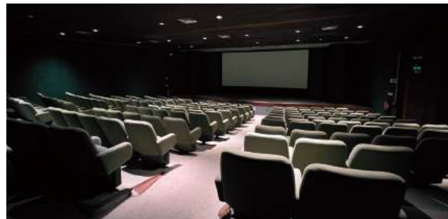
Fecham 10 salas de uma vez

Parece que, em breve, ir ao cinema em Coimbra no lado direito do Mondego será uma experiência tão rara quanto encontrar estacionamento à porta da Sé Velha. A NOS Lusomundo Cinemas decidiu que dez salas no Alma Shopping são areia a mais para o seu camião e prepara-se para bater com a porta em Dezembro deste ano. A decisão de não renovar o contrato (que tecnicamente expirou em Abril de 2025) foi tomada pela exibidora, que, num gesto de "extrema caridade" corporativa, aceitou prolongar a estadia até ao final do ano para dar tempo à gestora do shopping de encontrar outra utilidade para aquele espaço. Talvez uma pista de bowling para estudantes desesperados? A estratégia da NOS para Coimbra parece seguir a dieta do "menos é mais". Enquanto o Alma Shopping diz adeus às suas dez salas, a exibidora assegurou um contrato de médio/longo prazo no Forum Coimbra. Ou seja: passamos de um banquete de 16 salas comerciais para um "snack" de apenas seis. Em 2019, o Alma recebia mais de 241 mil espectadores; em 2025, o número já ia minguando. A nossa autarca, Ana Abrunhosa, já veio avisar que o Forum passará a ser o último baluarte do cinema de massas na cidade. Mas para os resistentes do cinema alternativo, resta a Casa do Cinema de Coimbra, nas Galerias Avenida - um projecto que sobrevive desde 2021 e que, agora, arrisca-se a ser o único local onde o projector não se sente sozinho.