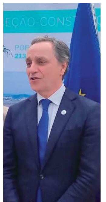
Até o Ambiente está farto de água