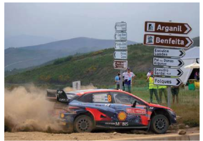
Arganil volta a receber o Rally de Portugal, com dupla passagem por um troço renovado, disputado em sentido inverso e com chegada junto à mítica Casa do PPD

A autarquia lançou também um Guia do Espectador, com horários, acessos, estacionamento, condicionamentos de trânsito e informação útil para quem pretende acompanhar a classificativa no terreno. Na sexta-feira, a serra volta a falar alto e, em Arganil, isso costuma ouvir-se muito antes de se ver o primeiro carro.