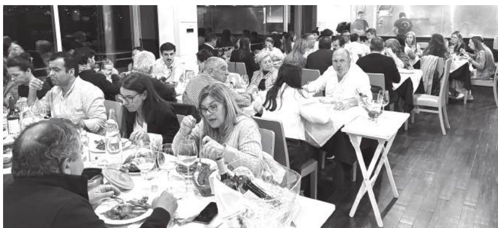
Amigos, clientes e boa disposição marcaram a inauguração da Nova Churrasqueira, na Várzea, em Coimbra

Várzea, em Santa Clara, acaba de ganhar um novo ponto de encontro para quem aprecia comida feita com tempo, carvão e sabor. A Nova Churrasqueira abriu recentemente portas em Coimbra, num espaço totalmente remodelado e pensado para receber clientes, fa-