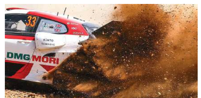
Góis volta a receber o Rally de Portugal, com uma classificativa em terra marcada pelas exigentes estradas serranas do concelho

Em Góis, o rally volta a cruzar paisagens de serra, estradas exigentes e zonas onde a velocidade se mistura com a técnica. Este ano, a classificativa surge apenas com uma passagem e em sentido inverso face a edições anteriores, o que acrescenta dificuldade aos pilotos e interesse para os adeptos. A organização descreve o troço como rápido e sem margem para erro, com a paisagem das cumeadas de Góis a servir de cenário a um desafio que promete ser decisivo