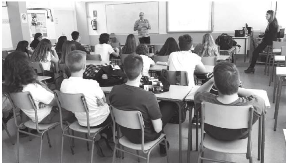
A escola pública depende de professores com estabilidade, recursos e tempo para acompanhar os diferentes ritmos dos alunos

Devolver voz aos professores significa reconhecer a sua autoridade profissional para experimentar, avaliar, partilhar práticas e construir transformação a partir do trabalho pedagógico. Sem essa dimensão pública, os docentes são chamados a responder à