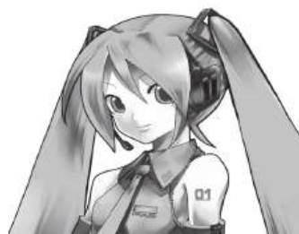
Cantora não é real, mas uma personagem virtual

Chegámos, oficialmente, àquela altura do ano em que nomes são anunciados para os maiores festivais de verão, e não só. Há festas, viagens medievais, e, claro, concertos em nome próprio. Um deles vai acontecer no dia 27 de Novembro, no Campo Pequeno, em Lisboa, e tem uma particularidade que deixou muitos de queixo caído: a cantora, na verdade, não existe. Chama-se Hatsune Miku e é um dos grandes ícones actuais da música japonesa, contudo, não é uma pessoa real, mas sim uma personagem virtual. Foi criada em 2007 e, rapidamente, se transformou num fenómeno global. Aliás, de acordo com a promotora “Everything is New”, esta tornou-se mesmo uma “referência cultural, marcando presença em diversas áreas e destacando-se especialmente pelos seus inovadores espectáculos ao vivo”. Os seus concertos