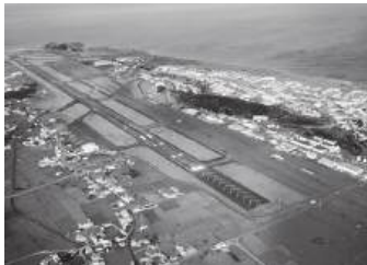
Os aviões dos EUA têm utilizado a Base das Lajes

O Mundo mudou, é certo, e é também sabido que as relações entre os países também, sobretudo depois de em 2022 ter eclodido uma guerra às portas da Europa. Entretanto, abriram-se novas brechas no Médio Oriente, e Portugal vai andando ao “sabor”