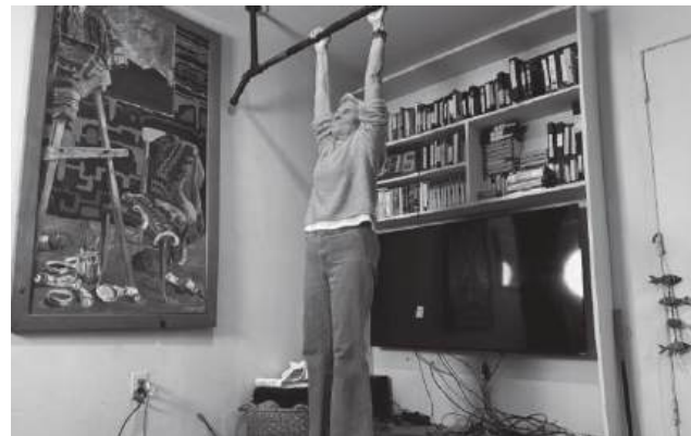
Aos 90 anos quebrou recorde do Guinness