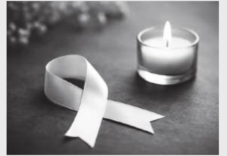
O aumento do subsídio de funeral corrige uma falha antiga do sistema e devolve alguma justiça a famílias em momentos de extrema vulnerabilidade