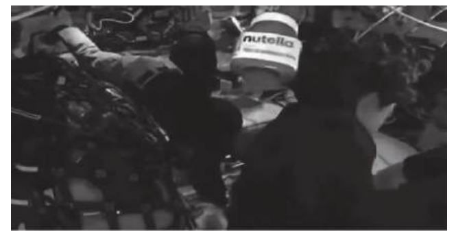
Nutella no espaço