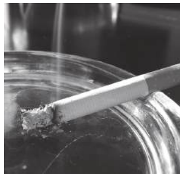
Pode-se fumar mais que o SNS recebe menos

Parece que o nosso Serviço Nacional de Saúde (SNS) acaba de levar com um “choque de gestão” que, curiosamente, cheira a fumo. O Governo decidiu dar um “toque” na fórmula de financiamento vinda do imposto sobre o tabaco e o resultado é uma daquelas dietas orçamentais de fazer inveja a qualquer ginásio. Até agora, o SNS ficava com tudo o que passasse dos 1.466 milhões de euros de receita do tabaco e, em 2025, isso rendeu uns simpáticos 186 milhões de euros. Mas como o excesso de dinheiro pode causar tonturas, o Governo fixou agora a quota em apenas 2% da receita líquida. Resultado? O montante cai para uns modestos 33 milhões. São menos 153 milhões de euros! O Governo explica que o modelo antigo era muito incerto, porque dependia de excedentes apurados tardiamente, e adopta uma “lógica fascinante”: para resolver o problema de não saber quanto dinheiro (muito) se ia receber, decidiu-se receber muito menos, mas com a garantia absoluta de que será pouco. Dizem que é para evitar que o dinheiro seja gasto em “despesas correntes” (como pagar salários ou gize) e focar na prevenção (prevenir que