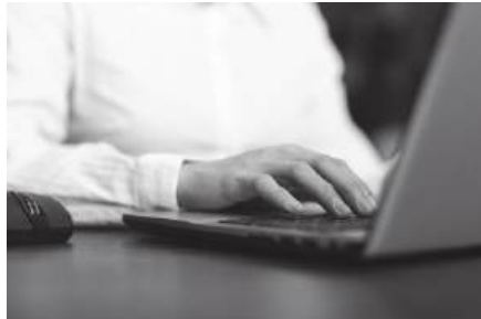
Governo comprou aplicação NewsWhip

“invasiva”, de ler o jornal antes de ele ser escrito. Aqui está o resumo desta vibrante e “preditiva” amizade entre o Estado e a tecnologia: Esqueçam os binóculos e as escutas em becos escuros, porque o Governo investiu 40 mil euros numa aplicação chamada NewsWhip, para garantir que sabe exactamente o que os jornalistas andam a fazer, mas com a elegância de quem apenas “analisa tendências”. A ferramenta pode, de facto, criar listas de jornalistas com base no impacto mediático e volume de produção, mas isso é apenas um detalhe estatístico, não um “quem é quem” para futuras chamadas de atenção. Graças a modelos preditivos, o Governo agora sabe o que vai ser viral antes de o público carregar no like. É quase como ter uma bola de cristal, mas paga com o dinheiro dos contribuintes e alojada na Irlanda. Vigilância? Credo! A Secretaria-Geral do Governo “rejeita liminarmente” palavras feias como “catalogação” ou “vigilância”. Prefere chamar-lhe “pesquisa em fontes abertas”. É como espreitar o Facebook do vizinho: se está lá, é para se ver, certo? Portanto, caros jornalistas, escrevam à vontade. O Governo não está a vigiar; está apenas a certificar-se de que o “alcance potencial” é devidamente apreciado nos gabinetes oficiais. Afinal, quem não gosta de ter um fã tão atento e tecnologicamente avançado?