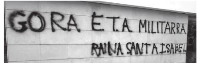
Viva a ETA Militar- tradução da língua basca (euskera)