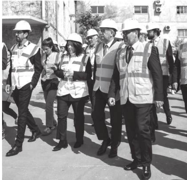
António José Seguro foi recebido em Pombal por Pedro Pimpão, no âmbito da Presidência Aberta dedicada às regiões afectadas pelas tempestades

O Presidente da República, António José Seguro, esteve, no dia 9 de Abril, no concelho de Pombal, numa deslocação integrada numa Presidência Aberta dedicada aos territórios mais afectados pelas recentes tempestades. A visita teve como propósito ouvir a população, avaliar no terreno os efeitos da tempestade Kristin e recolher informação sobre as principais necessidades de recuperação, na sequência dos prejuízos humanos e materiais registados na região. Durante a passagem por Pombal, o chefe de Estado recebeu das mãos do presidente da Câmara Municipal, Pedro Pimpão, o contributo do município para o PTRR, assente no programa municipal Renascer e Avançar Pombal. Segundo a autarquia, o documento aponta para a necessidade de um investimento global de 270 milhões de euros em projectos considerados prioritários para o concelho. Entre as principais intervenções