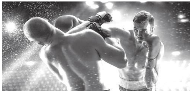
Filho de Biden desafio filhos de Trump para uma luta

Esqueçam os debates presidenciais com cronómetros e moderadores impacientes. A nova era da política norte-americana parece ter trocado os púlpitos pelo ringue e os argumentos por ganchos de direita. Hunter Biden, aos 56 anos, decidiu que a melhor forma de responder a anos de ataques pessoais é através de uma luta de artes marciais mistas (MMA). O desafio foi lançado: Hunter Biden contra a dupla dinâmica, Donald Trump Junior (48 anos) e Eric Trump (42 anos).