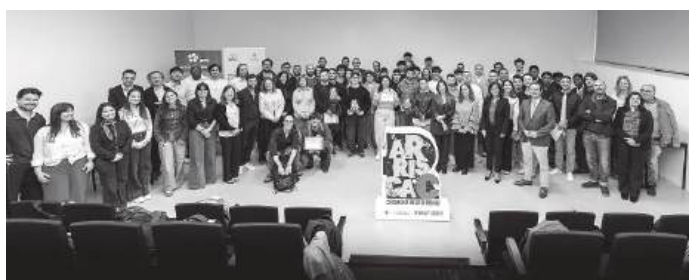
Foram distinguidas, com mais de 71 mil euros em prémios monetários e de apoio ao desenvolvimento, ideias de negócio em cinco categorias

Organizado pela Universidade de Coimbra (UC) - no âmbito do projecto INOVC+: Ecosistema de Inovação para a Transferência de Conhecimento e Tecnologia da Região Centro, com o apoio do Programa Regional do Centro - Centro 2030 - o Arrisca C visa contribuir para a criação de spin-offs académicas e empresariais e startups, estimulando o desenvolvimento de conceitos e projectos semente em áreas científico-tecnológicas como Recursos Naturais e Bioeconomia; Materiais, Tooling e Tecnologias de Produção;