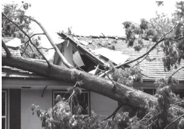
Os dados serão para fins académicos

Está a decorrer um estudo sobre o impacto económico e social das tempestades ocorridas em Janeiro e Fevereiro no concelho de Pombal, no âmbito de um projecto da Faculdade de Economia da Universidade de Coimbra. A iniciativa tem como principal objectivo compreender de que forma estes fenómenos meteorológicos afectaram as famílias do concelho e identificar as consequências sociais e económicas resultantes desses acontecimentos. Para o efeito,