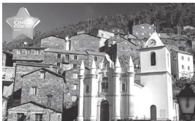
Piódão continua a encantar quem o visita e soma mais uma distinção nacional