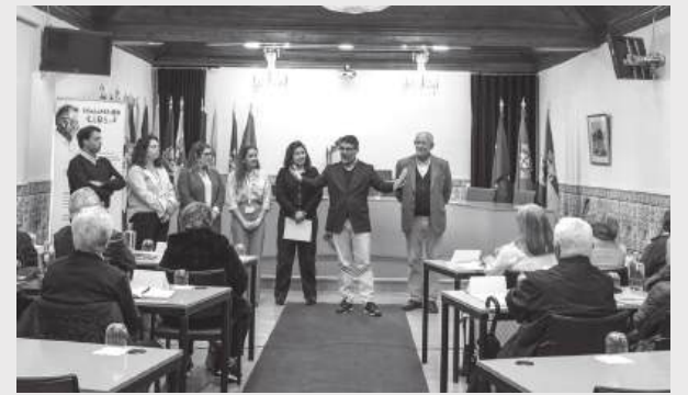
Iniciativa reforça o compromisso do Município de Pombal com o envelhecimento activo, saudável e feliz

vando a identificação de problemas e a construção de soluções mais ajustadas às necessidades reais da comunidade. A iniciativa visa ainda promover um envelhecimento saudável, feliz e activo, reforçando a participação cívica e a inclusão social das pessoas idosas. Ao mesmo tempo, procura contribuir para a redução de estereótipos e preconceitos associados ao envelhecimento, promovendo uma visão mais positiva e valorizadora do papel dos seniores na sociedade. A Assembleia Municipal Sénior insere-se na Estratégia Municipal para o Envelhecimento Activo, Saudável e Feliz 2024–2030, que estabelece um conjunto de acções orientadas para a promoção da autonomia, da saúde, da participação e do bem-estar da população idosa, incluindo a criação do Espaço Sénior. Este trabalho é também reforçado pelo Programa CLDS 5G, que, em articulação com a estratégia municipal, veio aumentar a capacidade de intervenção do Município junto da população sénior. Dessa colaboração nasceu o Plano de Acção “Idade-MAIOR”, no qual se integra a realização da Assembleia Municipal Sénior.