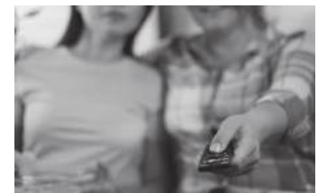
A exploração das pessoas rede audiências

Há muito que se constrói, em televisão, uma realidade que não existe. Programas como ‘A Casa dos Segredos’ (TVI) ou ‘Casamentos à primeira vista’ (SIC) são o exemplo maior do fim da esperança na Humanidade e na Humanização. Apesar de entreterem o público e um País que, por vezes, precisa de catarses para esquecer a sua realidade,