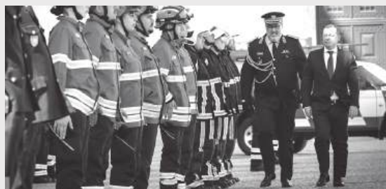
A Associação Humanitária de Bombeiros Voluntários de Coimbra completou, a 7 de Abril, 137 anos