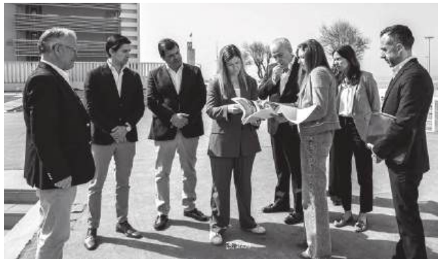
Uma das prioridades é desbloquear a Piscina Mar

A visita terminou na vila de Maiorca, com o foco no Paço de Maiorca e no Palácio Conselheiro Branco, edifícios que exigem investimentos elevados para a sua recuperação. No balanço da jornada, a ministra deixou duas notas importantes para o calendário local: as comemorações do Dia Internacional da Juventude, a 12 de Junho, irão realizar-se na Figueira da Foz e existe a possibilidade de a cidade acolher o encontro final de 2026 sobre o papel do Estado na Cultura.