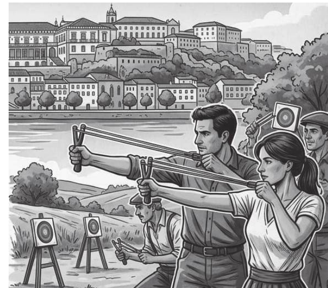
As vidraças dos vizinhos e os melros estão a salvo

Quem diria que, em pleno século XXI, a grande inovação tecnológica de Coimbra não viria de um laboratório da Universidade, mas sim do fundo de uma gaveta poeirenta? Preparem os elásticos e escolham os melhores calhaus (ou talvez algo mais civilizado), porque no dia 3 de Maio, a partir das 9h00, a cidade vai testemunhar o Primeiro Torneio de Fisgas de Coimbra. Esqueçam o Padel ou o Crossfit, pois a modalidade que realmente corre nas veias - aquela que outrora fez tremer as vidraças dos vizinhos e as canelas dos melros - ganha finalmente o estatuto de desporto oficial. O evento terá lugar no Campo de Tiro de Antanol, do Clube de Caça e Pesca de Coimbra Sul, um local habituado a pólvora, mas que agora se prepara para o silvo bem mais ecológico de uma tira de borracha a esticar. Numa era de ecrãs e sedentarismo, a organização convida-nos a “substituir os elásticos” e a abraçar o espírito do “Desporto para Todos”. O melhor de tudo é que não precisa de ser um atleta olímpico. Nesta fase inaugural não há requisitos específicos: basta ter vontade de conviver e, preferencialmente, não acertar no próprio pé. É a democratização do tiro ao alvo, acessível a qualquer um. Se ainda tem a sua fiel fisga guardada desde a quarta classe, esta é a sua hora de glória. As inscrições já estão abertas através do email ccpcoimbrasul@gmail.com ou do contacto 910 345 130.