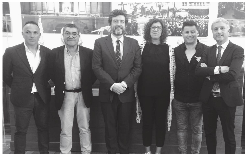
Oliveira do Cravo volta a ser vila depois de o ter sido, durante séculos, desde a sua carta de foral, em 1177, até à reorganização administrativa do século XIX

-se sem pedir licença à geografia periférica.