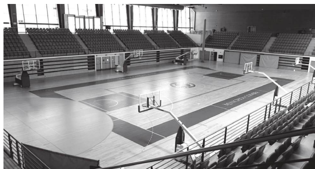
O desporto não teve tolerância