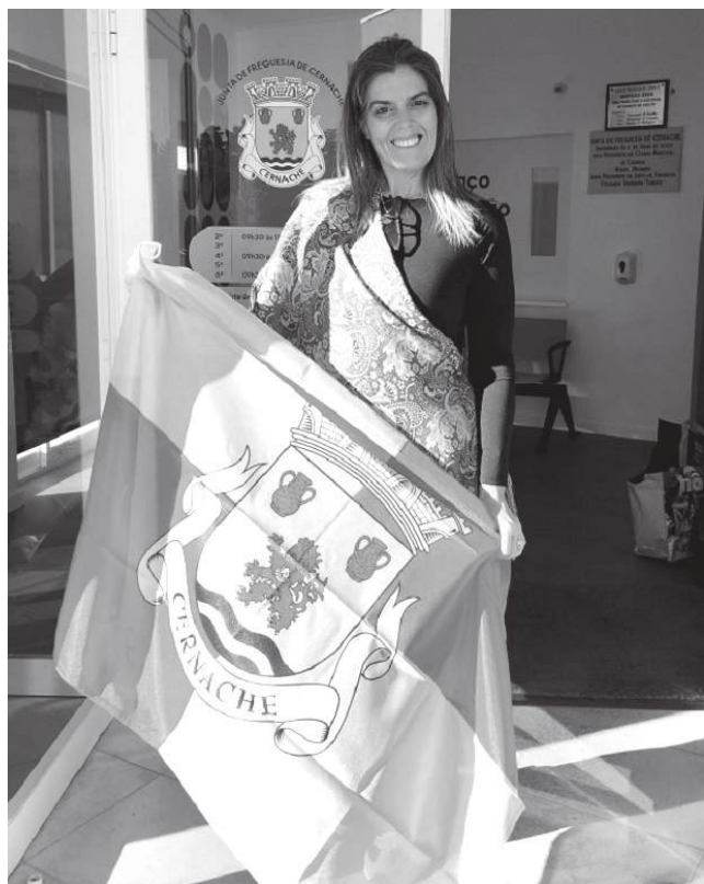
O novo estatuto oferece, a Cernache, visibilidade, reforça auto-estima e ajuda a dar nome político a um espaço que quer afirmar-se sem pedir licença à geografia periférica

É nesse ponto que esta notícia deixa de ser apenas local e passa a dizer alguma coisa sobre o país. Portugal é também feito destas comunidades que resistem ao apagamento, à centralização, ao envelhecimento e à ideia, tantas vezes repetida, de que só os grandes centros contam. Quando uma terra sobe a vila, não muda de escala por milagre. Mas ganha um sinal político de existência. E, num tempo em que tantas regiões lutam por manter escola, comércio, serviços, habitantes e futuro, esse sinal tem um valor que não deve ser subestimado.