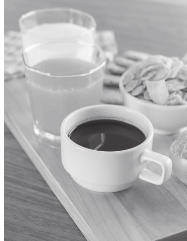
Valores diferentes para produtos iguais

Quem conhece cidades médias do Interior e também as grandes urbes (como Lisboa e Porto), há muito que já percebeu que os mesmos produtos em locais diferentes do País são tabelados à medida do vendedor. Se nas grandes superfícies – como supermercados – os alimentos já não variam muito de preço entre o Interior e o Litoral, o mesmo não se pode dizer, por exemplo, nos cafés, pastelarias e restaurantes, só para dar alguns exemplos. É impressionante como o preço de um café, uma garrafa de água ou de um sumo de laranja varia, de cidade para cidade ou de vila para vila, muitas vezes com diferença de um euro. Se é certo que cada um impõe os valores que quer, também é verdade que são as margens quem mais ordena. No final, já se sabe, os preços são à vontade do freguês e à medida dos bolsos de cada um. O País desigual, das assimetrias, de que tanto falamos vezes sem conta é o mesmo País que pratica preços diferentes para produtos iguais. O poder de compra dos portugueses sabemos bem por que ruas da amargura anda, e a realidade é só uma: são os reféns de sempre, no meio de tanta veia comercial sem vergonha, quem paga a factura. Há quem lucre, quem ganhe e também quem esqueça a espinha dorsal na hora da cobrança. Portugal no seu melhor! Ou será que é mais no seu pior?