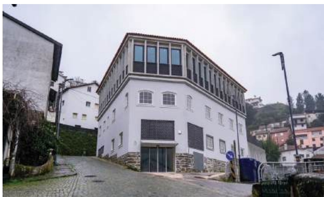
O Pampilhosa Business Center, novo equipamento municipal vocacionado para acolher empresas, espaços de coworking e projectos de incubação, está localizado onde era a antiga casa do doutor António Afonso, médico histórico do concelho

O autarca diz que as consequências dos incêndios e das tempestades continuam por resolver. “Os incêndios já aconteceram há quase um ano e ainda não temos normalizados vários aspectos, como as estradas, a sinalética e a limpeza de bermas. Continuamos à espera do valor total do apoio prometido pelo Governo central, que, além disso, fica muito aquém das nossas necessidades. A depressão Kristin também causou danos avultados,