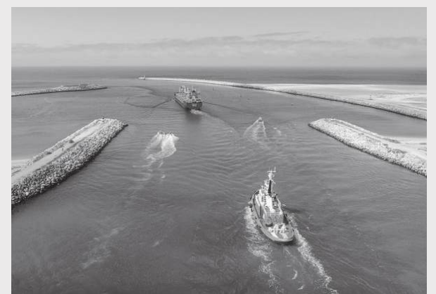
As empresas procuraram alternativas nos portos de Aveiro, Leixões, Setúbal e Lisboa

pacto negativo “brutal” na economia da região Centro e consequências ambientais “catastróficas”. A origem do problema é alvo de discórdia entre as entidades envolvidas, com a Comunidade Portuária a responsabilizar a Agência Portuguesa do Ambiente (APA) por uma drágagem errada. Alega-se que uma intervenção de 28 milhões de euros retirou e depositou areia em locais incorrectos, facilitando a sua deslocação para a barra durante os temporais. A APA classifica estas acusações como “pura especulação” e afirma que não existe ligação entre as obras de transposição de areia e o assoreamento da barra. Por outro lado, a Administração do Porto atribuiu a situação a um assoreamento “excepcional e inesperado”, agravado por sucessivas tempestades marítimas que impediram a navegação por questões de segurança.