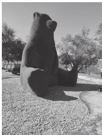
Um ícone que sobreviveu ao fogo e à água

Parece que o nosso plantigrado favorito da margem direita do Mondego decidiu, finalmente, abandonar o seu visual “pós-apocalíptico”. Após meses a servir de tela para pirómanos de ocasião e de ter sobrevivido ao abraço lamacento da depressão Kristin e das cheias de Fevereiro, o Urso do Parque Verde está de cara lavada - ou melhor, de revestimento renovado. A Câmara Municipal de Coimbra, num gesto de carinho por este ícone que já viu mais água e fogo do que muito bombeiro veterano, investiu cerca de 4.500 euros para curar as feridas da estrutura. É um valor modesto para salvar um símbolo, mas considerável se pensarmos que o investimento foi gasto a “tapar buracos” deixados por quem confunde património público com lenha para fogueira. E é fascinante observar a resiliência deste urso. Ele é, possivelmente, o habitante mais paciente da cidade: aguentou estoicamente os actos de vandalismo que o deixaram parcialmente queimado em meados do ano passado; manteve-se firme enquanto a depressão Kristin tentava levá-lo para um passeio pelo rio; sobreviveu às cheias de Fevereiro, provando que, em Coimbra, para ser monumento, é preciso saber nadar. A autarquia aproveitou o momento para recordar o óbvio: os equipamentos públicos são de todos e para todos. Não deixa de ser