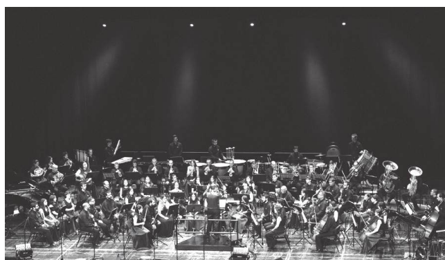
Filarmónica União Taveirense celebra 157 anos de vida ao serviço da música e da cultura em Taveiro

A programação do aniversário de 2026 reflecte precisamente essa identidade plural da Filarmónica União Taveirense. Não se trata apenas de assinalar uma data, mas de abrir portas à comunidade e de