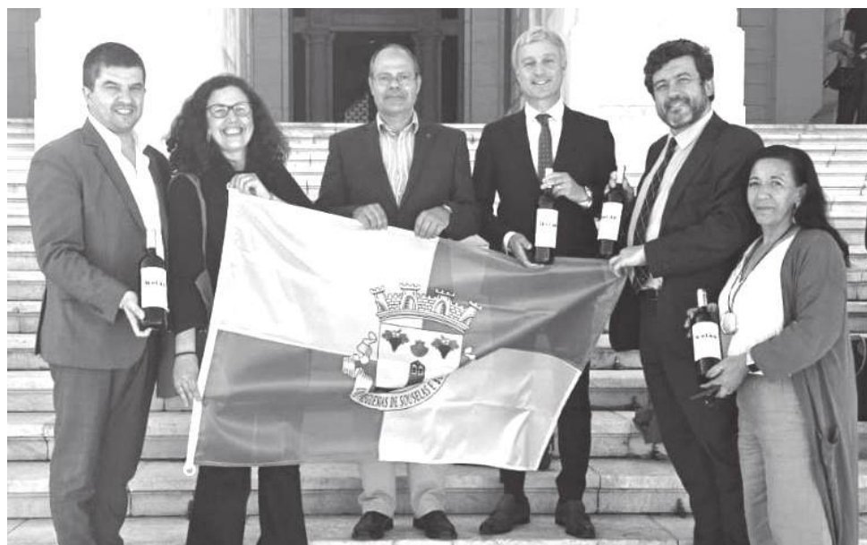
Botão ganha agora outra presença pública, outra capacidade de se apresentar ao exterior e de transformar reconhecimento em oportunidade

Na Assembleia da República, a decisão foi tomada por unanimidade. O consenso político, num tempo em que quase tudo parece dividido, deu ainda maior peso simbólico ao momento. Não se tratou apenas de