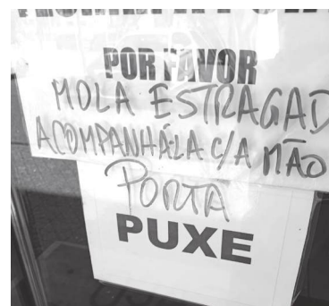
Uma das principais portas do Estádio Cidade de Coimbra

Uma das principais portas do Estádio Cidade de Coimbra, precisamente a de acesso à Pista de Atletismo, está, há meses, à espera de desejável manutenção. Desejável, satisfatória e, se não for pedir muito, duradoura. A ‘pobre’ porta apenas tem sido objecto de