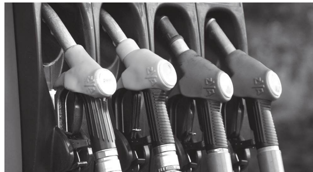
Os impactos são os mesmos do costume

O Mundo, a Europa e Portugal têm em cima das suas cabeças mais uma crise energética à vista. Com consequências ainda incalculáveis e danos severos, a médio/longo prazo, para os consumidores. A Agência Internacional de Energia já veio dizer que, no contexto da União Europeia, esta crise pode prolongar-se e que os cidadãos devem, e já, começar a implementar um plano que comporte medidas de poupança. E mesmo que a guerra acabe em breve, os efeitos - abastecimento e preços - podem durar anos. Há quem vá até mais longe, como o chanceler alemão, Friederich Merz, que considera que será igual à Covid-19 e à guerra da Ucrânia. As recomendações não se fazem esperar, seja de recurso ao teletrabalho, suspensão de viagens longas ou uso dos transportes públicos. Por cá, a ministra do Ambiente e Energia, lembra que Portugal tem grandes recursos nas