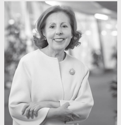
A ministra trouxe uma ideia que muitos têm defendido: recuperar a carreira de “guarda-rios”

Voltando às obras no Baixo Mondego, reconhece-se que a tutela do Ambiente está a avançar com “determinação” - opinião partilhada por associações de agricultores que se dizem tranquilos com o ritmo dos trabalhos nos diques e canais -, mas a ministra enfrenta o desafio de coordenar estas intervenções com o calendário agrícola. A meta é ter o canal de rega pronto em Maio, um prazo vital para a sobrevivência das culturas de arroz e milho da região. A rapidez na resposta aos autarcas e a presença física nas obras do Mondego conferem a Maria da Graça Carvalho o papel de figura central na gestão da crise pós-cheias, tentando equilibrar a urgência ambiental com as necessidades económicas do Vale do Mondego. Embora a tutela directa da Agricultura não seja a sua, a ministra actuou como interlocutora chave para garantir a viabilidade da campanha agrícola. Para esta boa prestação de Maria da Graça Carvalho contribui o seu longo percurso em cargos de decisão, tanto a nível nacional como europeu. Foi ministra da Ciência e do Ensino Superior (2002-2004) e ministra da Ciência, Inovação e Ensino Superior (2004-2005), eurodeputada pelo PSD em dois mandatos e conselheira principal do Bureau de Política da Comissão Europeia.