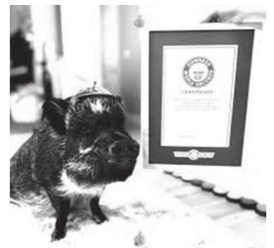
Merlin, o porco mais famoso da internet

O certo é que, tal como as centenas de influenciadores digitais que temos pelo mundo fora, também Merlin tem direito a esse título. Afinal, não sabemos quantos outros animais se vão sentir influenciados pelo porco mais famoso da internet a aprenderem a expressar-se de uma forma única e original. Seria algo interessante para os tutores que sempre sonharam em falar com os seus bichos, mas também desafiante: é que só falta mesmo os nossos seres de quatro patas aprenderem a falar para mandarem totalmente em casa.