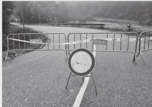
Os Municípios não têm recursos financeiros nem técnicos suficientes para reparar estradas e outras infra-estruturas afectadas pelo temporal e as cheias

Mais de 25 anos depois de Portugal se ter tornado membro da Agência Espacial Europeia (ESA), o Observatório Geofísico e Astronómico da Universidade de Coimbra ingressa, como primeiro membro português, no grupo de especialistas do serviço de meteorologia da organização. Este passo coloca, de forma inédita, uma instituição nacional numa rede técnica europeia dedicada à observação, análise e previsão de fenómenos solares e geomagnéticos com impacto na Terra. O tema pode parecer distante, mas tem efeitos directos no quotidiano. A rede de meteorologia espacial da ESA fornece