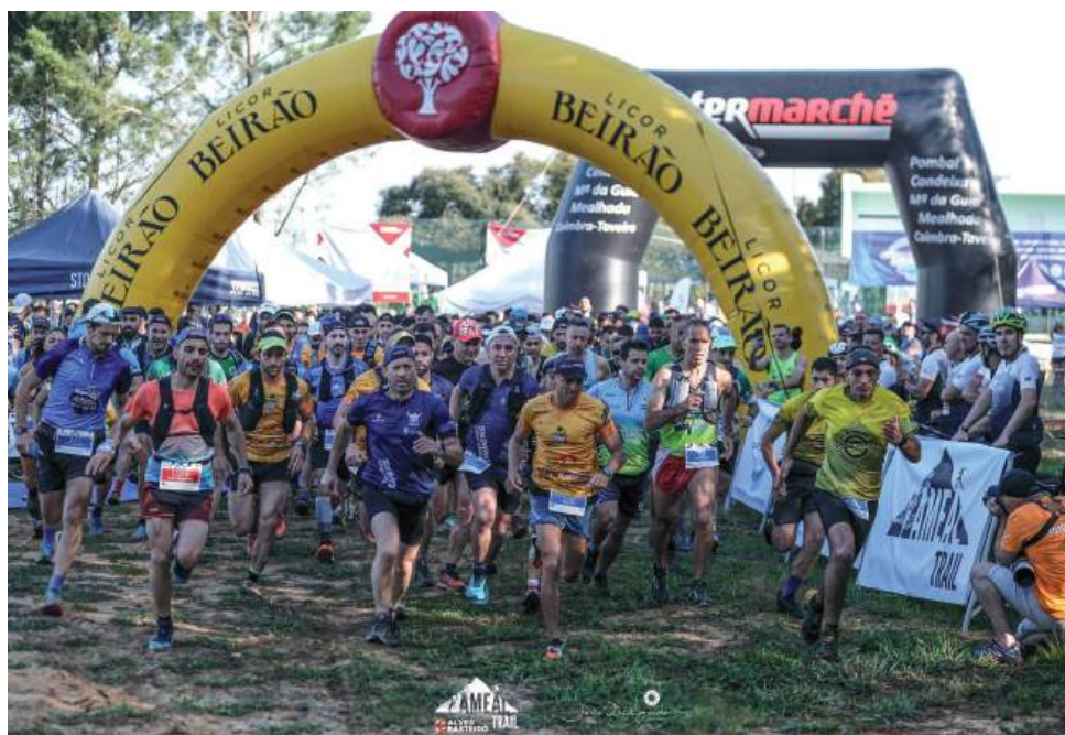
Mesmo antes da partida desta edição, a organização já admite novas ideias para o futuro, incluindo a possibilidade de criar mais uma distância e reforçar a programação de sábado

Nem sempre é o cartaz, nem sempre é a paisagem que faz crescer uma prova. No caso do Ameal Trail, o impulso parece vir de um elemento mais raro e mais decisivo: a autenticidade. Nos dias 11 e 12 de Abril, o Ameal volta a receber uma das iniciativas desportivas mais mobilizadoras da região, numa edição que confirma a vitalidade de uma prova afirmada passo a passo e trilho a trilho. Depois de um crescimento sustentado, o evento regressa com forte adesão popular e a ambição intacta de proporcionar uma experiência genuína num modelo cada vez mais sólido e firme.