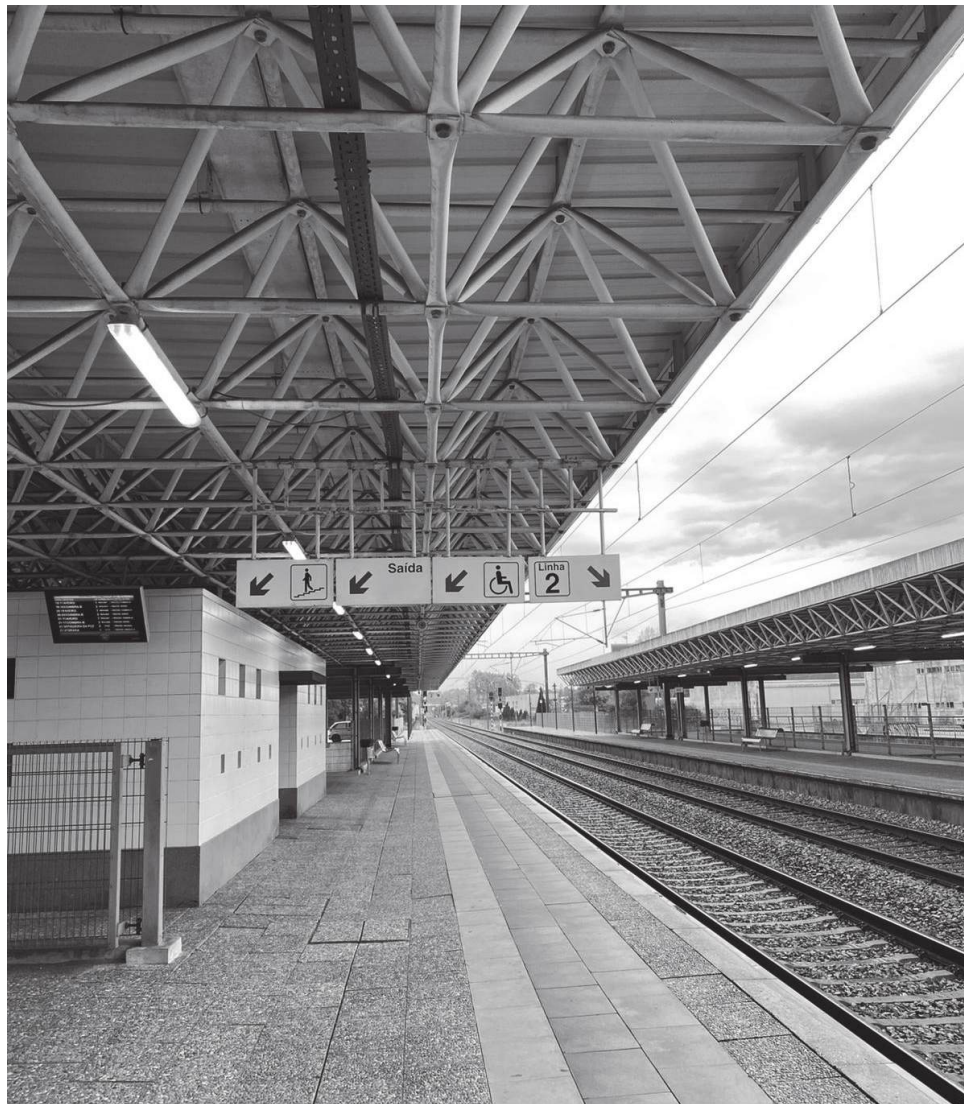
Estação ferroviária da Mealhada, local de partida e de regresso

Essa combinação de proximidade e escala humana define a experiência