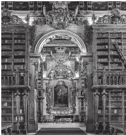
O valioso acervo vai desde os primórdios da tipografia aos finais do século XVIII