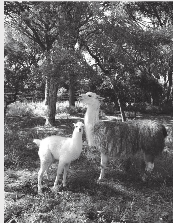
O Europaradise lançou uma campanha de angariação de fundos

O Europaradise - Parque Zoológico de Montemor-o-Velho lançou uma campanha de angariação de fundos para apoiar a reconstrução de viveiros, instalações e acessos, na sequência dos avultados danos causados pela depressão Kristin. Situado na vila de Montemor-o-Velho, no distrito de Coimbra, o Europaradise tem ao seu cuidado mais de 300 animais, de cerca de 60 espécies diferentes. O parque acolhe animais entregues por particulares, resultantes de apreensões efectuadas pelas autoridades, bem como animais idosos provenientes de outros jardins zoológicos, assumindo uma missão centrada no bem-estar animal e na educação para a preservação da biodiversidade. A passagem da tempestade Kristin, no dia 28 de Janeiro de 2026, provocou a queda de numerosas árvores de grande porte dentro do espaço, causando estragos significativos. De acordo com a informação divulgada, vários viveiros de animais ficaram destruídos ou danificados, os caminhos do percurso foram bloqueados e os acessos a instalações de apoio ficaram comprometidos. Uma nova estrutura que se encontrava em fase de construção sofreu tam-