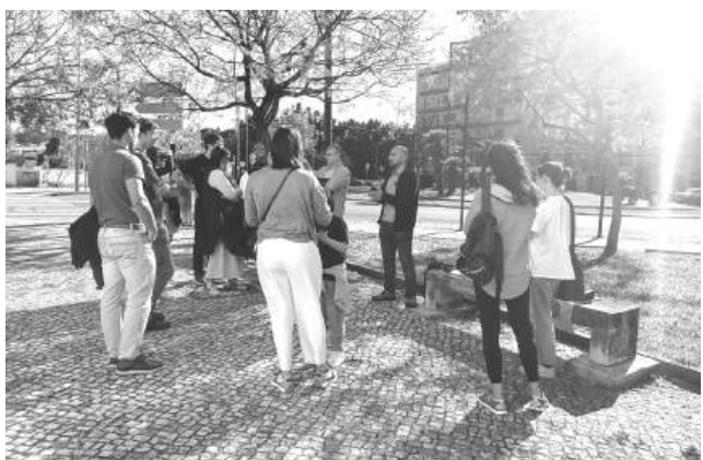
Encontro promovido pelo LIVRE discutiu a segurança rodoviária e a ocupação do espaço público

A pergunta aberta pela tragédia na Solum é esta: quantas vezes terá Coimbra de se comover com uma morte na passeira antes de decidir que os peões não podem continuar a ser tratados como um obstáculo ao trânsito, mas como os verdadeiros donos da cidade?