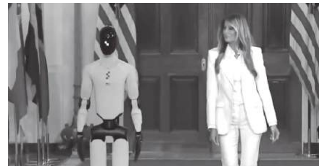
Melania Trump e o robô

Milhões e milhões de pessoas estão cansadas de ouvir o presidente dos Estados Unidos da América (EUA), Donald Trump, a falar sobre o que quer que seja. A sua esposa, Melania Trump, encontrou a solução perfeita para esses cidadãos! A primeira-dama dos EUA protagonizou um momento insólito ao surgir acompanhada por um robô humanoide durante um evento na Casa Branca. Tal aconteceu numa cimeira dedicada à promoção do acesso à educação e tecnologia, com foco na Inteligência Artificial (IA). Melania e o robô "Figure 03" entraram, juntos, na passeira vermelha, surpreendendo todos os presentes. O mais curioso de tudo: o robô discursou (e, há quem diga, que o fez melhor do que Donald Trump): "Obrigado por me convidar para a Casa Branca", disse. Além disso, cumprimentou quem por lá estava em várias línguas, mostrando-se, mais uma vez, um poliglota (novamente: cuidado Trump). Nas redes sociais, não faltou quem comentasse esta acção e houve até quem afirmasse que o "Figure 03" ganha a Trump na beleza. Será que, no futuro, a primeira-dama vai abdicar da presença do seu companheiro e optar pelo robô? Muitos dos cidadãos americanos (e não só) agradeceriam.