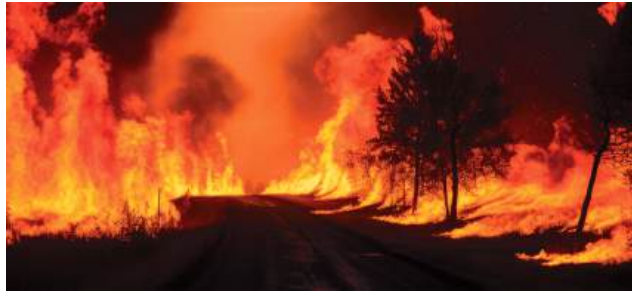
Só em Portugal e Espanha, 22 grandes incêndios queimaram 460.585 hectares em Agosto, quase metade da área total ardida na UE em 2025

No Verão, a situação agravou-se de forma dramática, sobretudo na bacia mediterrânica. Agosto trouxe uma vaga de calor prolongada que transformou vastas áreas de Portugal e de Espanha em território altamente vulnerável. Só nesses dois países, 22 grandes incêndios queimaram 460.585 hectares, quase metade de toda a área ardida na União Europeia durante o ano. O