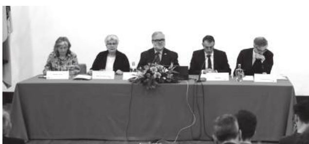
Especialistas e participantes reuniram-se em Cantanhede e Coimbra para debater o legado de João de Ruão, figura maior da escultura renascentista portuguesa