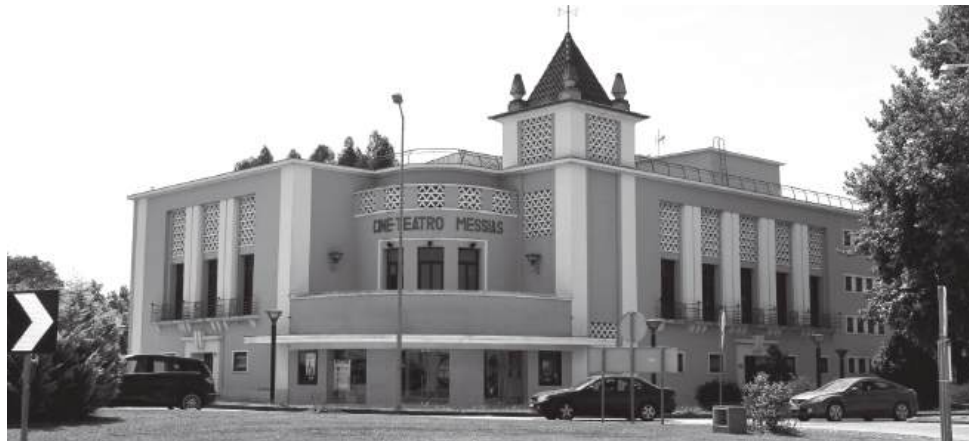
O Cine-teatro Messias foi reinaugurado no ano 2000 e tem servido a comunidade com dinamismo, bom nível de programação e capacidade de criação de público