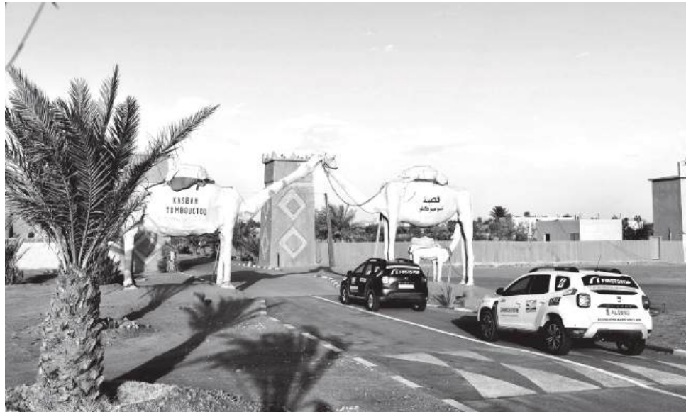
Marrocos volta a ser o destino de uma nova aventura do Clube Escape Livre, com 26 viaturas e 57 participantes

A nova aventura foi apresentada na Litocar, em Coimbra, mas o centro da história não esteve propriamente na sala cheia nem nos discursos protocolares: esteve no mapa. E esse mapa leva os participantes por nomes que, só por si, já convocam imaginação e pó