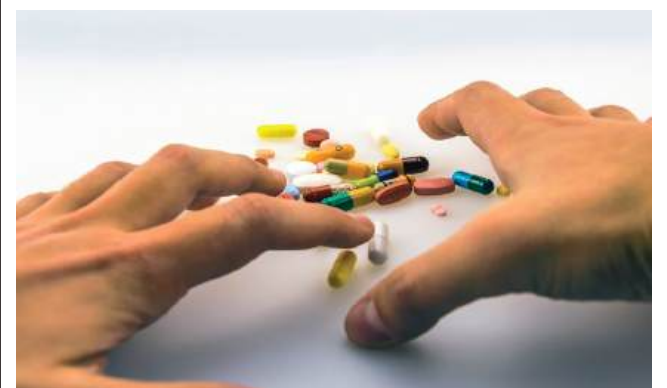
Regista-se um crescimento na percentagem de doentes que não fazem medicação por se sentirem bem (32,9% face a 21,9%)

Nesta fase está disponível um questionário em