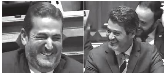
Aguiar-Branco deixa Parlamento a rir

Não falta por aí quem apelide o Parlamento de “circo” e parece que os políticos portugueses decidiram levar essa opinião à letra. Depois de, há alguns meses, o deputado do Partido Social Democrata (PSD), Gonçalo Capitão, ter-se tornado viral por ter dado uma aula de “stand-up comedy” ao Chega, agora o humor chegou também ao presidente da Assembleia da República. José Pedro Aguiar-Branco pôs o Parlamento a rir, numa intervenção inesperada que desarmou um confronto entre dois deputados. O momento surgiu na sequência de uma troca acesa de palavras entre André Ventura e Hugo Soares, que elevou o tom, criando um ambiente tenso no espaço. Como forma de restaurar a ordem, Aguiar-Branco decidiu intervir, de forma leve e divertida: “senhores deputados, (...) eu acho fantástico que tenham o coração sempre junto à boca. Uma taxa para cima, uma taxa para baixo; parece logo que é a coisa mais dinâmica e terrível que estamos a discutir na nossa democracia. Por amor de Deus. Guardem energia para outras coisas mais importantes. Há mais vida para lá do Parlamento”, afirmou, arrancando gargalhadas de todos os presentes. O certo é que o episódio tornou-se viral e veio mostrar que, mesmo nos lugares que exigem seriedade e decoro, é possível brincar. A vida é sempre mais fácil quando vivida com leveza... mesmo no Parlamento.