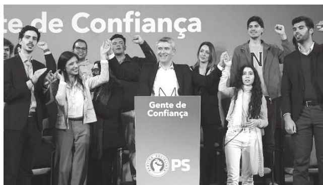
De Coimbra poderá estar um futuro líder distrital