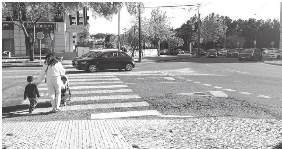
Sem semáforo, a passeira da Rua Eng.º Jorge Anjinho obriga os peões a atravessarem durante o fluxo da rotunda, num ponto que já se mostrou especialmente perigoso

O arquitecto e professor assistente convidado da Universidade de Coimbra Edu-