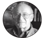
A.J. LINHARES FURTADO*

E m noticiário televisivo recente, assisti a cena de repugnantes agressões a jovem adolescente por número indeterminado de colegas, no recreio de escola de ensino secundário. Prostrado no chão e enrolado sobre si próprio, em auto protecção passiva, o jovem era incapaz de se defender dos repetidos pontapés, às vezes simultâneos, desferidos por outros jovens: alguns junto dele, pontapeando-continuamente (principais instigadores dos maus tratos?) como que em acção punitiva ou vingativa; outros, correndo e, sem pararem, acrescentavam mais um pontapé em qualquer parte do corpo e desapareciam de cena! Em arraste, por veze a vítima parecia deslocar-se ou ser empurrada pela violência dos pontapés. Outros fotografavam ou filmavam de perto!!!