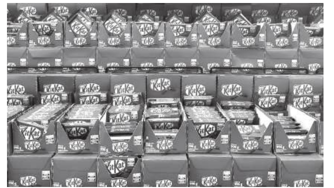
Roubadas 12 toneladas de KitKat

Adivinha-se uma Páscoa mais triste um pouco por todo o mundo. Tudo por conta da gula de alguém que decidiu apoderar-se de uma grande parte dos chocolates KitKat que estavam no mercado. No passado sábado (28), a Nestlé anunciou que mais de 413 mil KitKat foram roubados após terem saído da fábrica, em Itália, com destino ao mercado europeu. O número equivale a cerca de 12 toneladas de chocolate que já não vão chegar a centenas e centenas de famílias, pelo menos, não da forma correcta. Não vale a pena desejar uma forte dor de barriga ao ladrão destes doces porque, de acordo com a marca, o mais certo é que