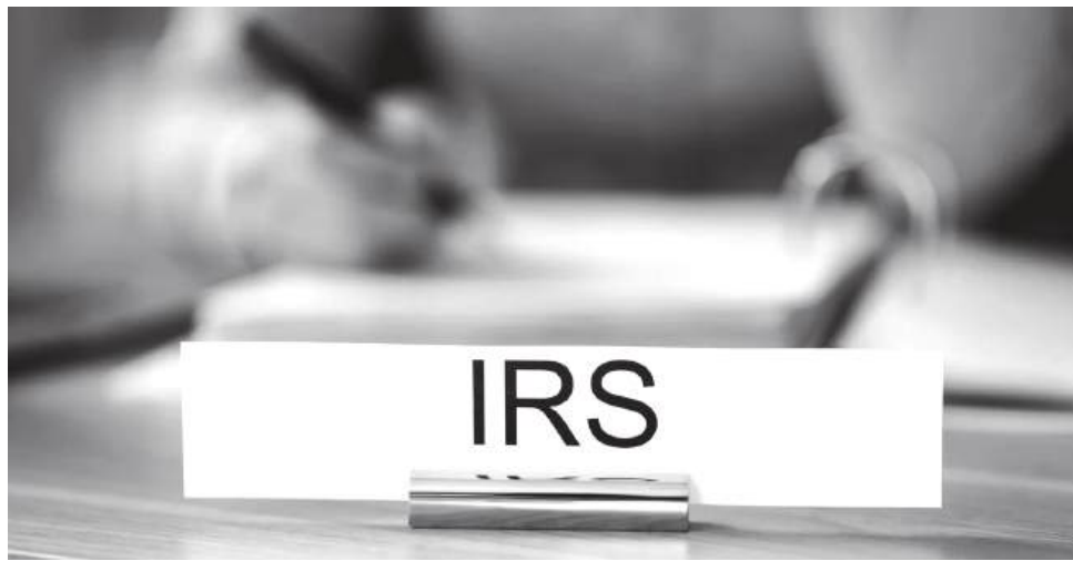
O mecanismo está previsto no artigo 152.º do Código do IRS e permite ao contribuinte destinar 1% do imposto liquidado a entidades de utilidade pública. Até 2024, esta percentagem era de 0,5%.

Volta a estar nas mãos dos contribuintes portugueses a possibilidade de apoiar, de forma simples e sem qualquer custo, algumas das instituições que todos os dias fazem a diferença na vida de tantas pessoas. Através da consignação de 1% do IRS, é possível encaminhar uma parte do imposto para entidades sociais, culturais, ambientais ou religiosas, ajudando directamente quem está no terreno a responder a necessidades muito reais. Para o ano fiscal de 2026, a Autoridade Tributária e Aduaneira (AT) já divulgou a lista de entidades elegíveis: são 5.505 instituições que podem beneficiar deste mecanismo.