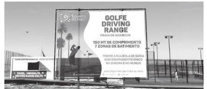
Revelado o segredo dos paus ao alto

Finalmente, a Figueira da Foz decidiu resolver o grande dilema existencial de quem frequenta a Praia de Buarcos: Como é que eu posso mandar uma bola para o mar sem ser um avançado da Naval 1º de Maio em dia de azar? A solução é de génio: um driving range na praia. Enquanto o comum mortal luta para estender a toalha contra o vento norte, o golfista de ocasião poderá agora praticar o seu swing com o bônus de um esfoliante natural gratuito - cortesia da areia e do vento. Diz o Município que este é o primeiro passo para o grande campo de 18 buracos no Bom Sucesso. É um plano brilhante: os turistas vêm pelo surf, mas ficam porque levaram com uma Titleist na nuca enquanto comiam um gelado na marginal. É a simbiose perfeita: se o swing for mau, a culpa é da nortada. Se for bom, foi o treino intensivo entre uma imperial e uma feijoada de búzios.