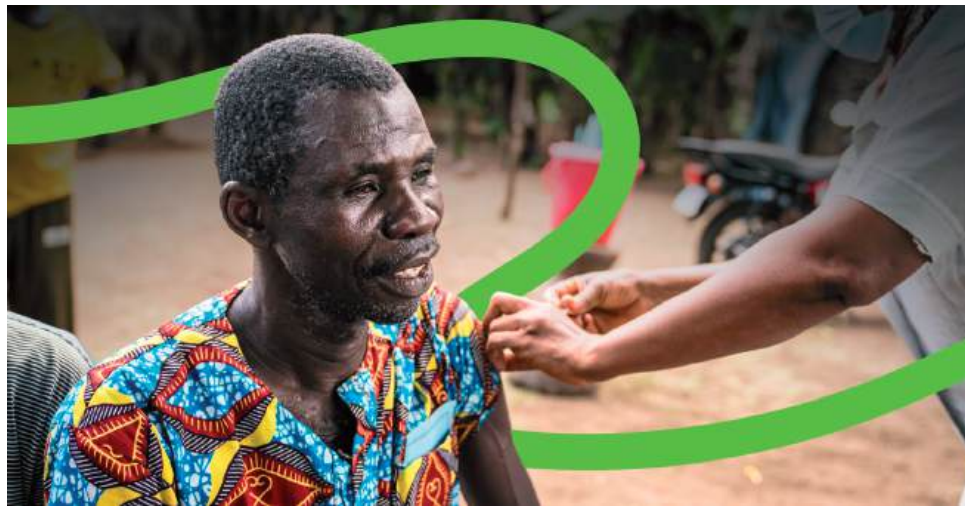
O conhecimento científico é essencial na saúde, desde dietas saudáveis até à água, saneamento, vacinas e medicamentos

A saúde melhorou substancialmente nos últimos 100 anos graças às inovações científicas e o futuro