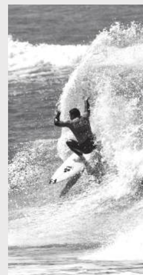
Etapa inaugural da Liga MEO Surf decorre de 2 a 4 de Abril na Praia do Cabedelo